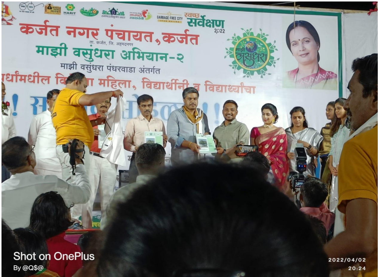
Shot on OnePlus By @Q$@